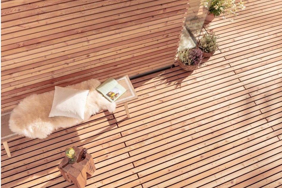
BU: MOCOPINUS fertigt die universellen Vollholzprofile aus Sibirischer Lärche. Diese Holzart ist besonders formstabil und punktet mit einer hohen Widerstandsfähigkeit. Daher eignet sie sich auch insbesondere für die unbehandelte Verarbeitung.