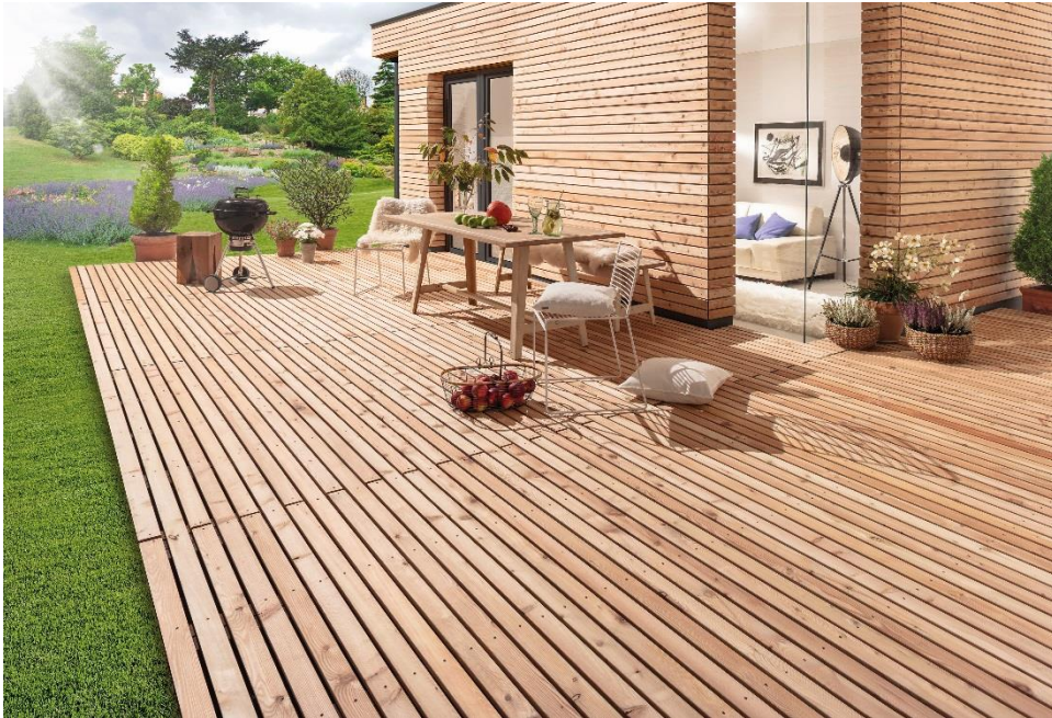
BU: Mit dem neuen Parallelogramm-Profil Laritec ist eine einheitliche Verlegung für die Fassade und den Outdoorbereich möglich. Damit entsteht aus zwei Elementen eine optische Einheit.