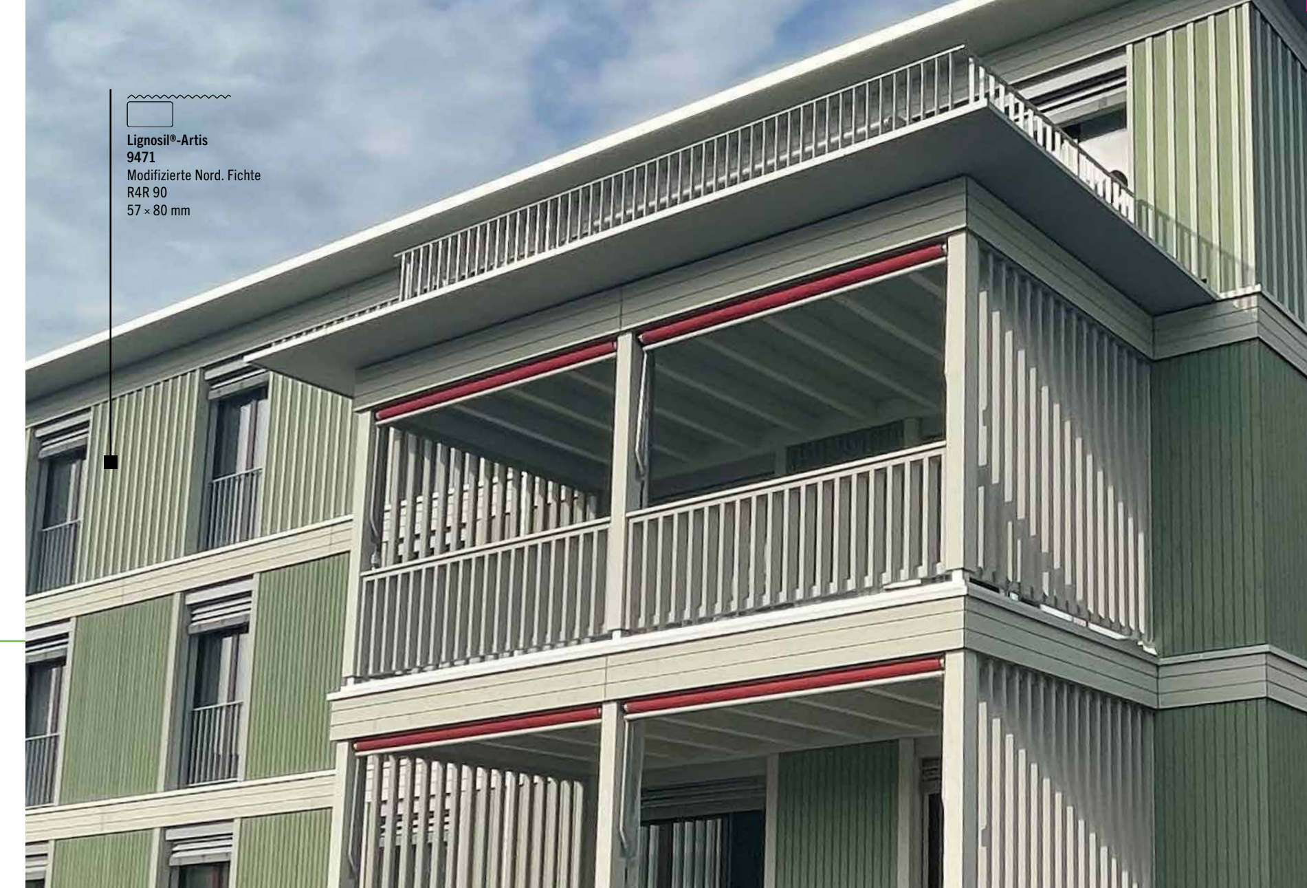
Lignosil®-Artis 9471 Modifizierte Nord. Fichte R4R 90 57 x 80 mm