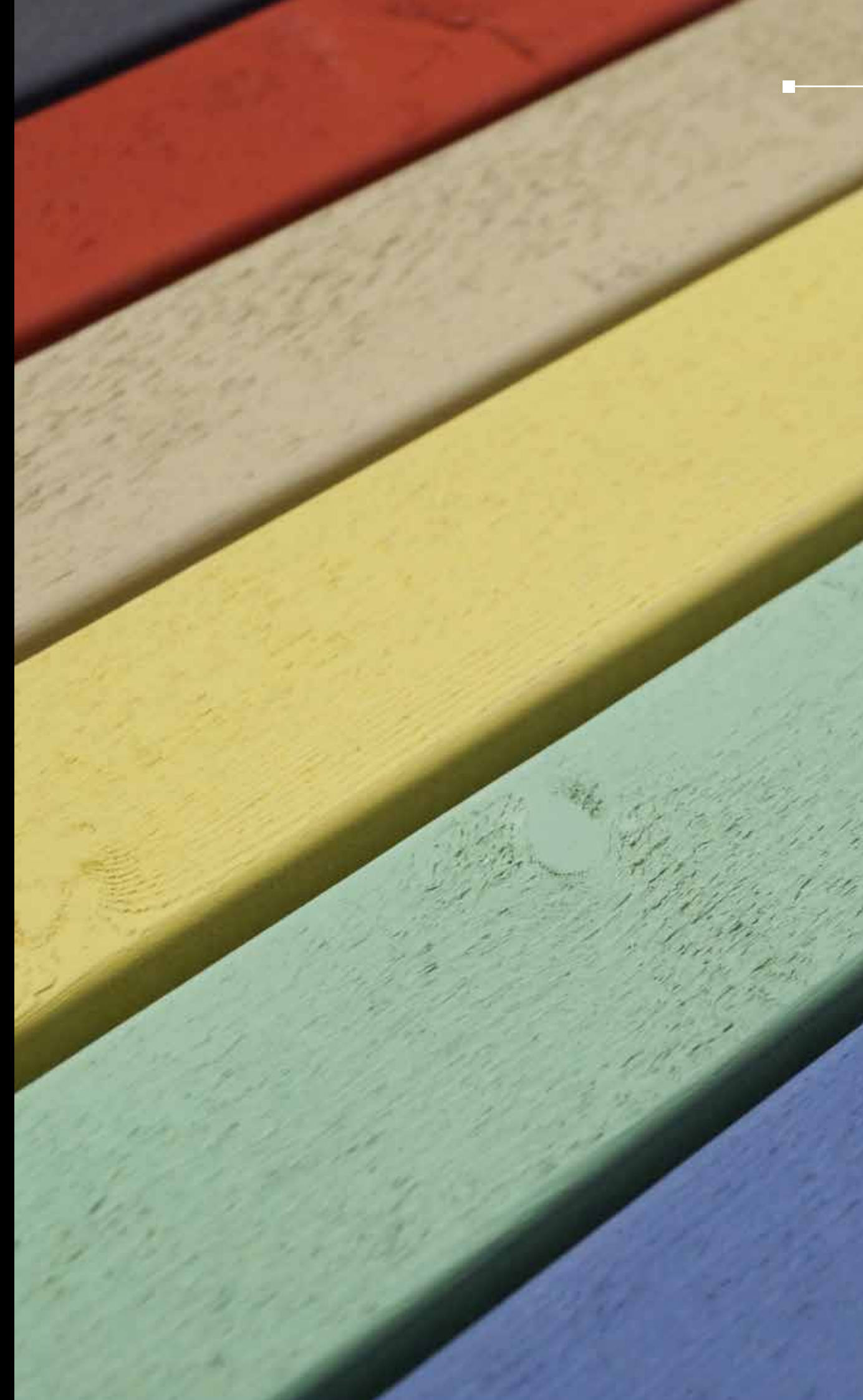
Lignosil®-Artis 9265 Modifizierte Nord. Fichte PAR 10 27 x 68 mm