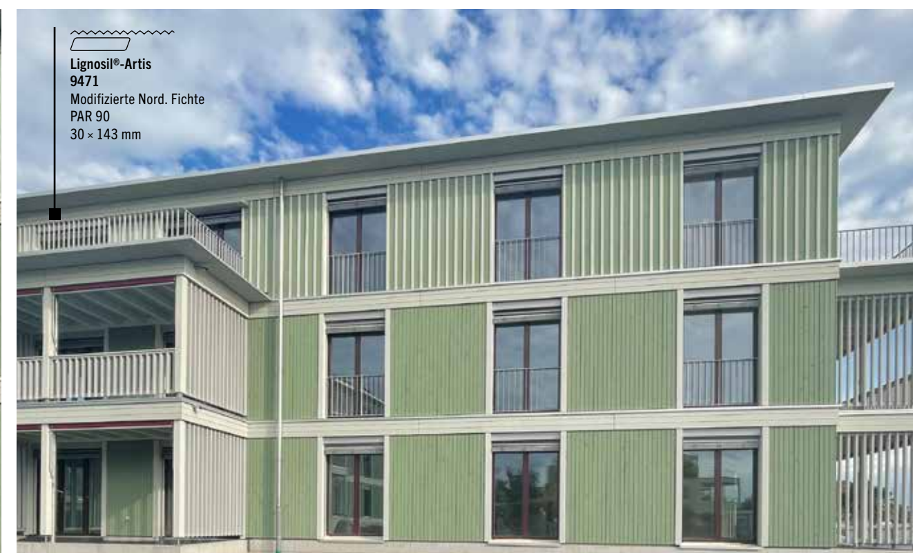
Lignosil®-Artis 9471 Modifizierte Nord. Fichte PAR 90 30 x 143 mm